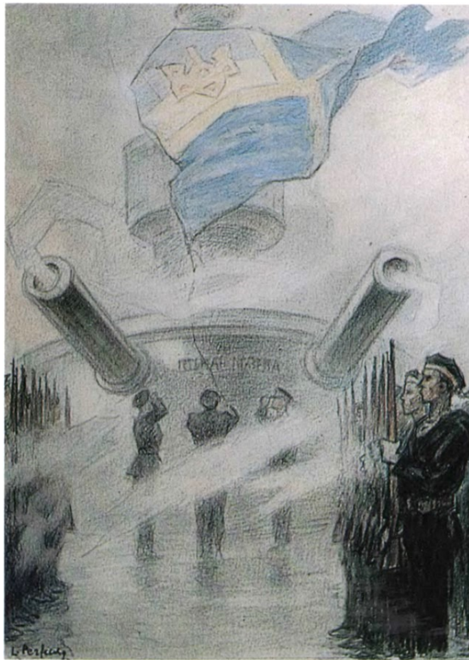
Піднесення українського прапору на Чорноморським флоті, 29 квітня 1918 р. Художник Леонід Перфецький

Масовою українізація флоту стала після першого всеукраїнського військового з'їзду, на якому висунуто вимогу зробити флот частиною збройних сил автономної України. Вирішувати питання українізації війська та флоту на з'їзді доручили Генеральному Військовому Комітету.