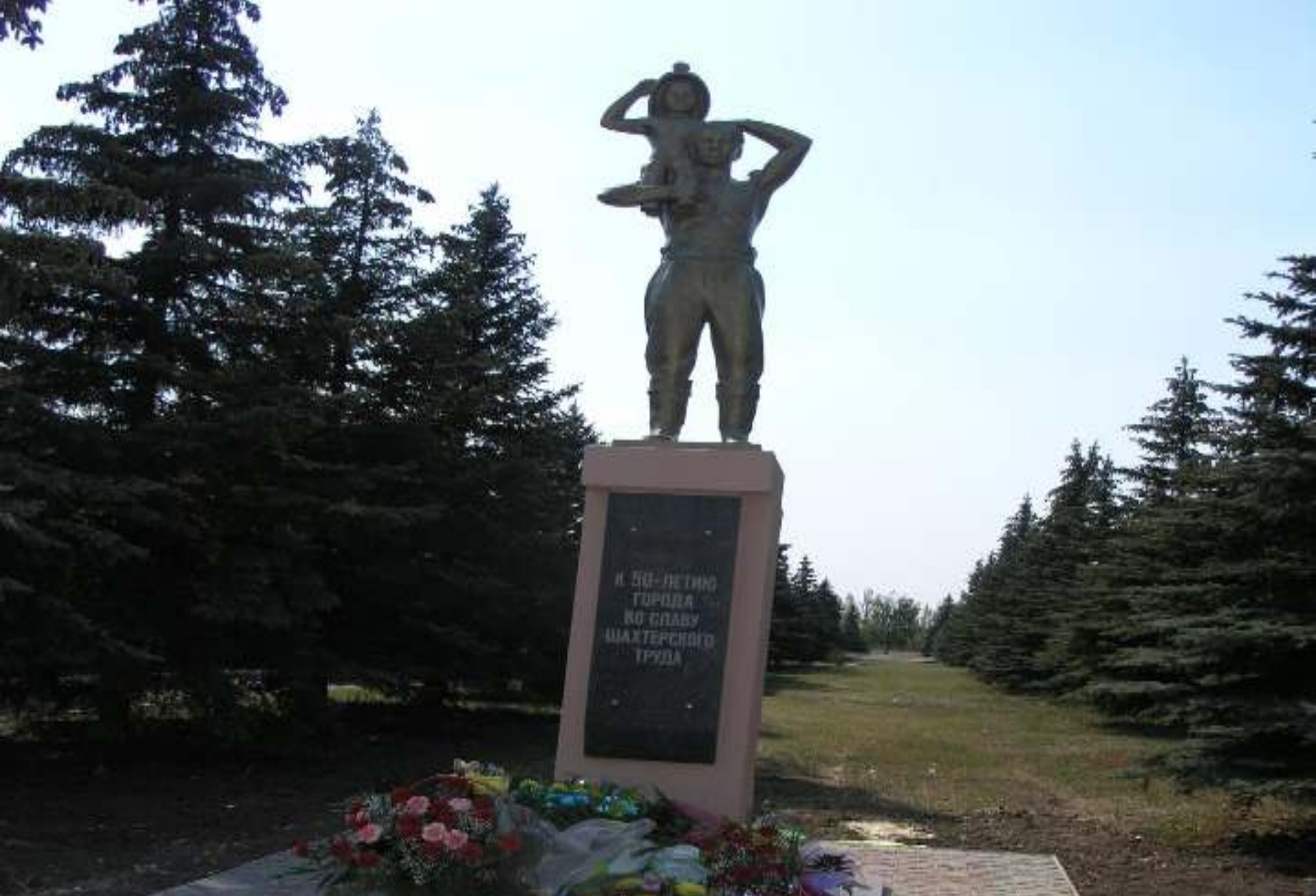
Пам'ятник до 50-річчя міста, на славу шахтарської праці. 2008 рік.