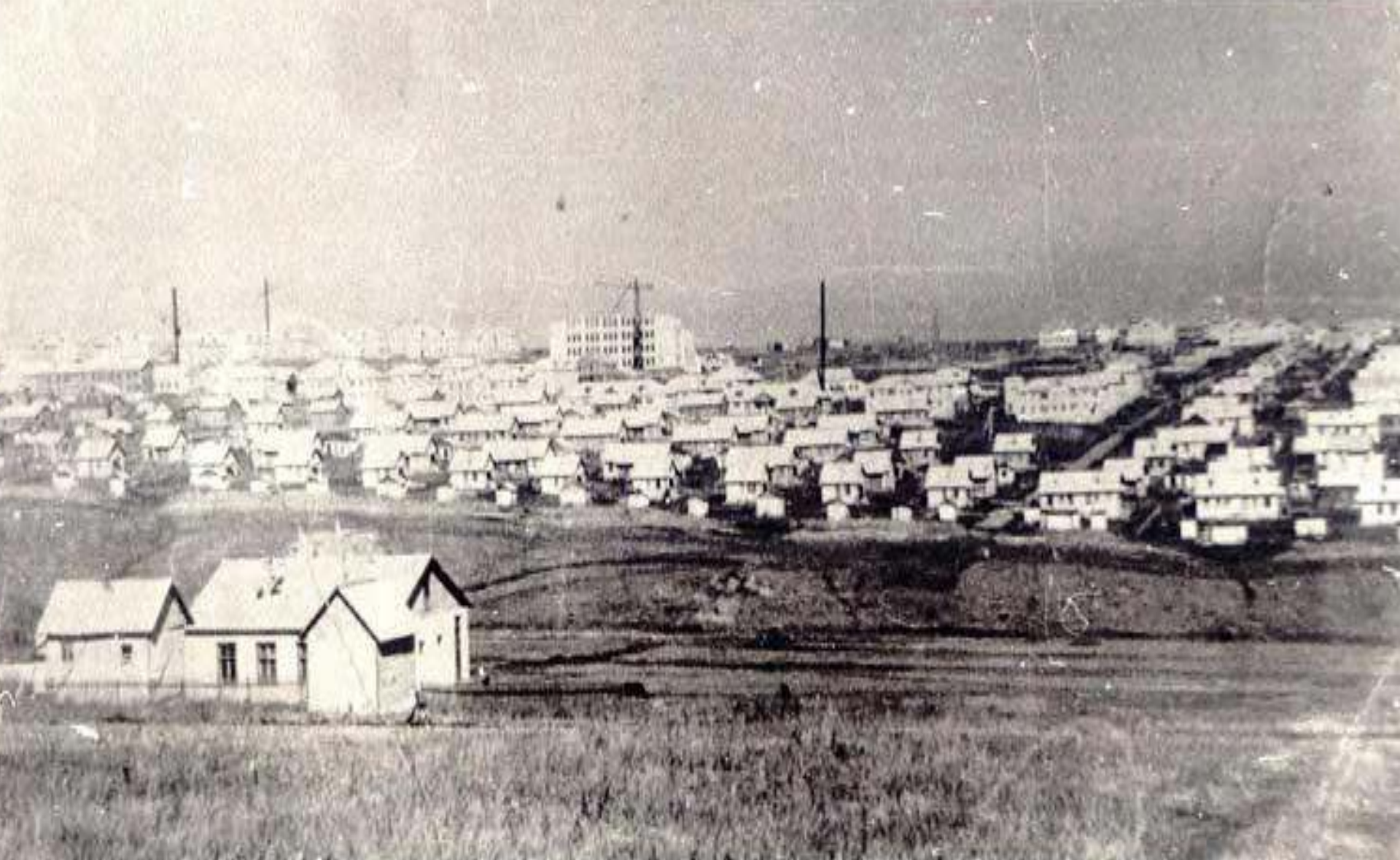
ГОРОД КИРОВСКОЕ, 1958 ГОД