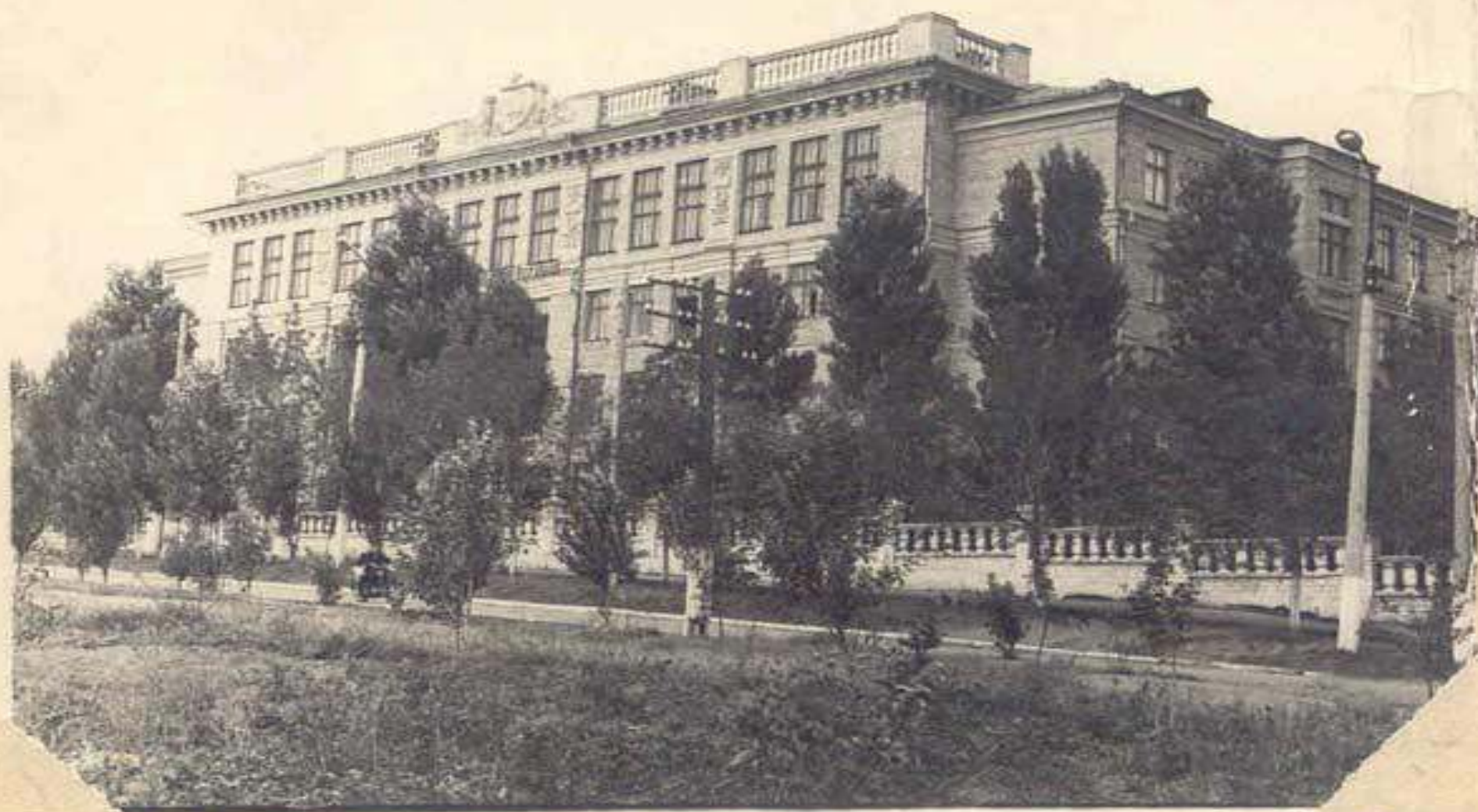
Здание педучилища 1967 г.