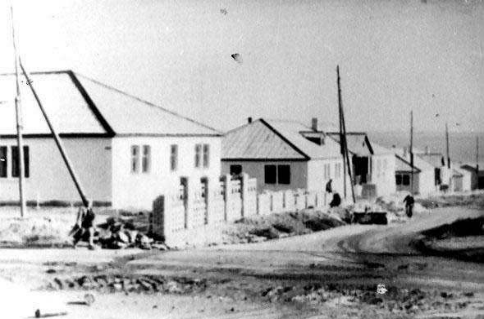
ПЕРВАЯ УЛИЦА СТЕПНАЯ