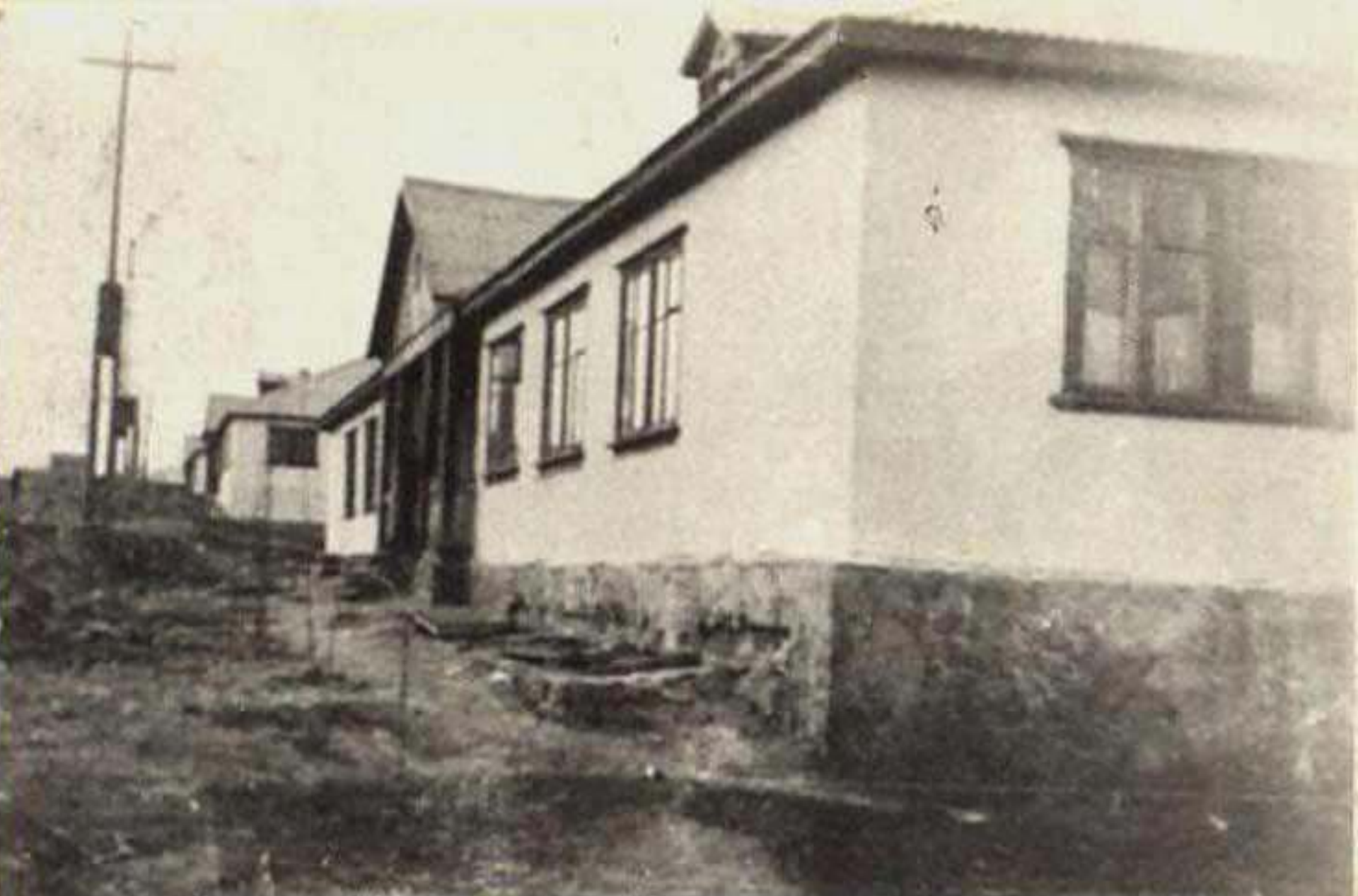
ПЕРВОЕ ОБЩЕЖИТИЕ ДЛЯ КОМСОМОЛЬЦЕВ