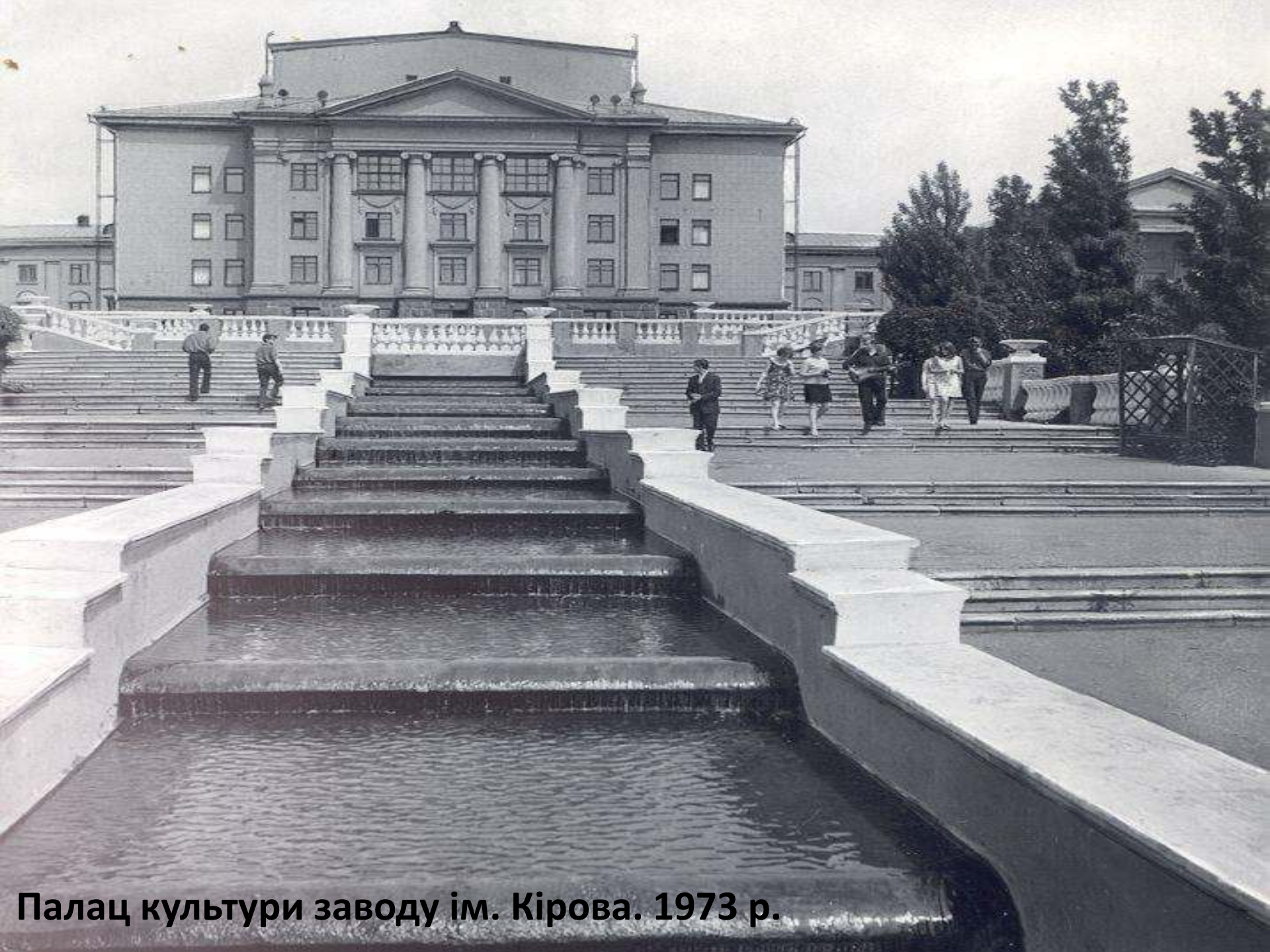
Палац культури заводу ім. Кірова. 1973 р.