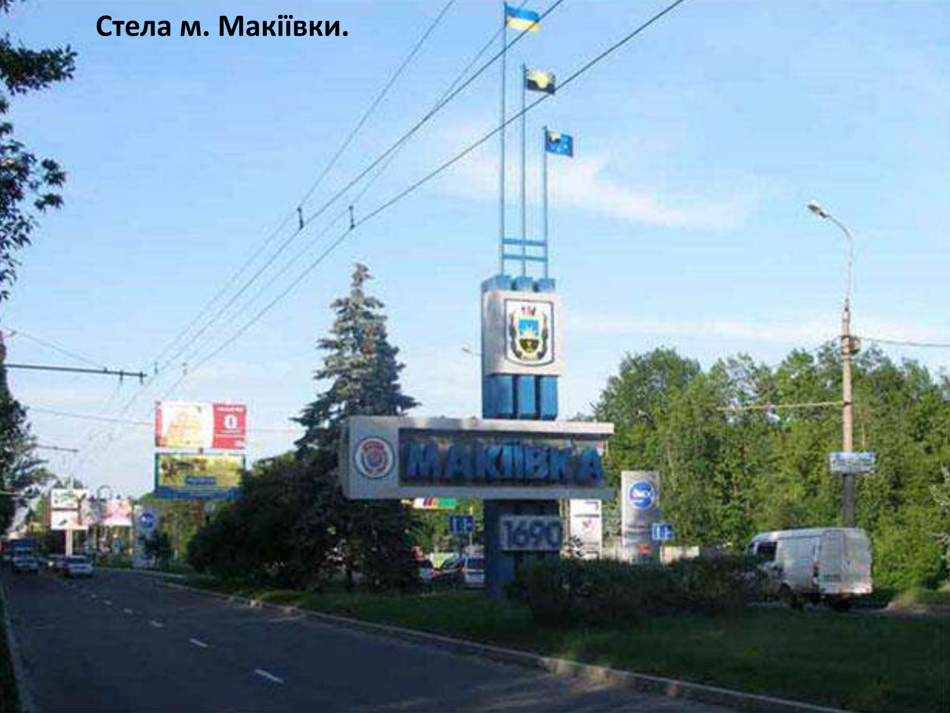
Стела м. Макіївки.