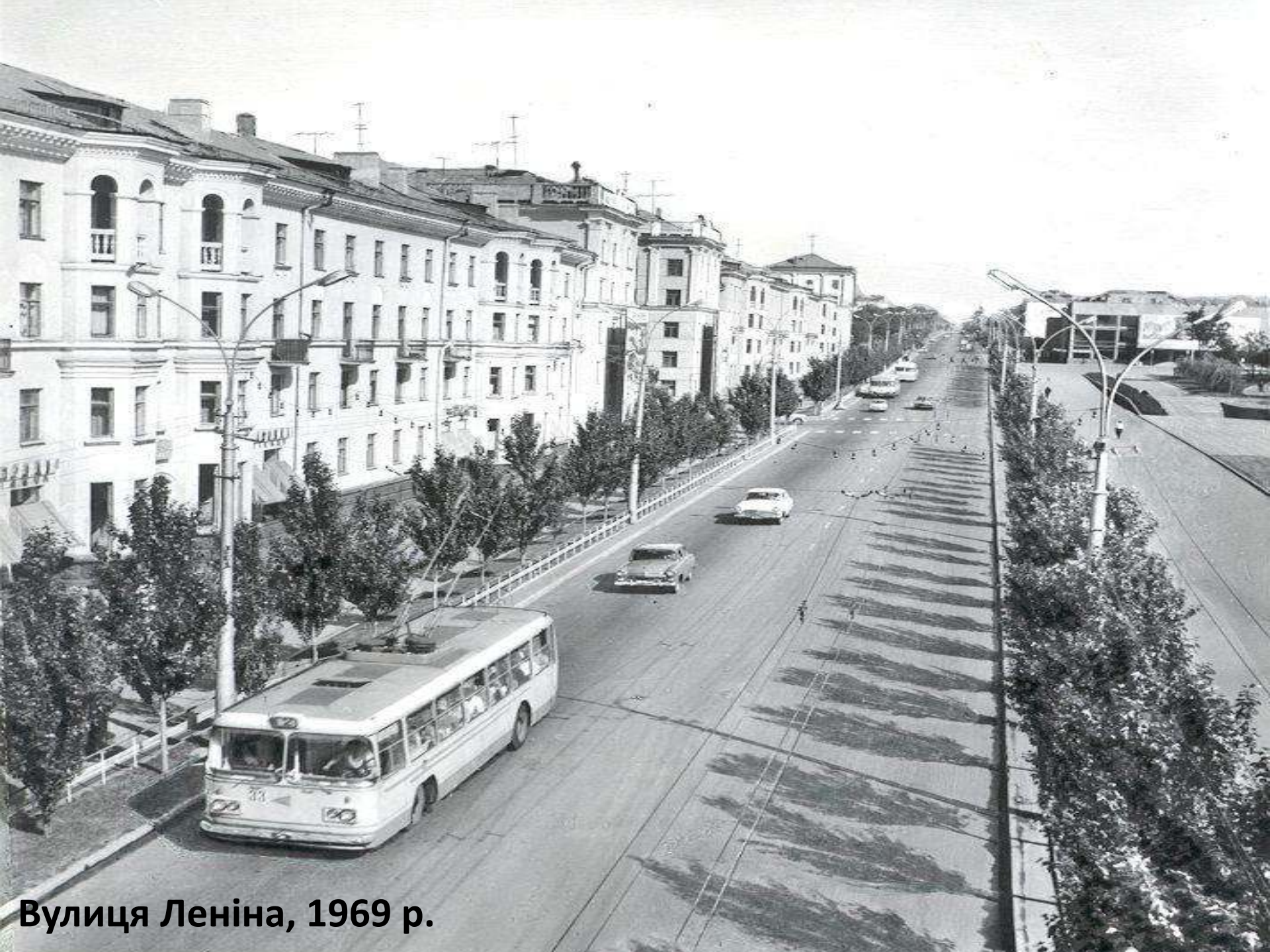
Вулиця Леніна, 1969 р.