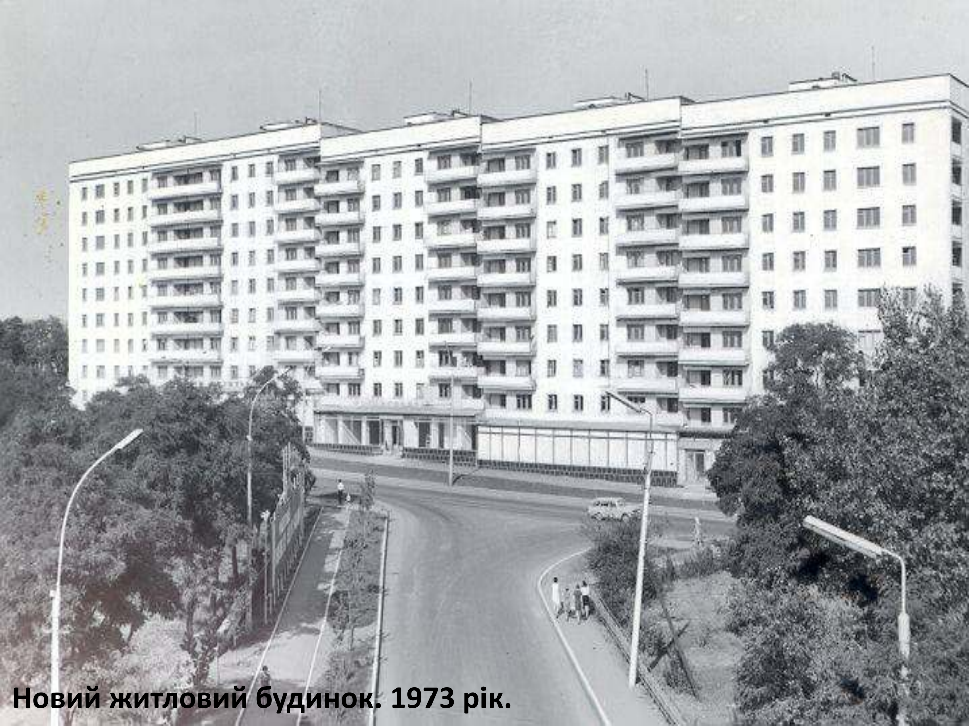
Новий житловий будинок. 1973 рік.