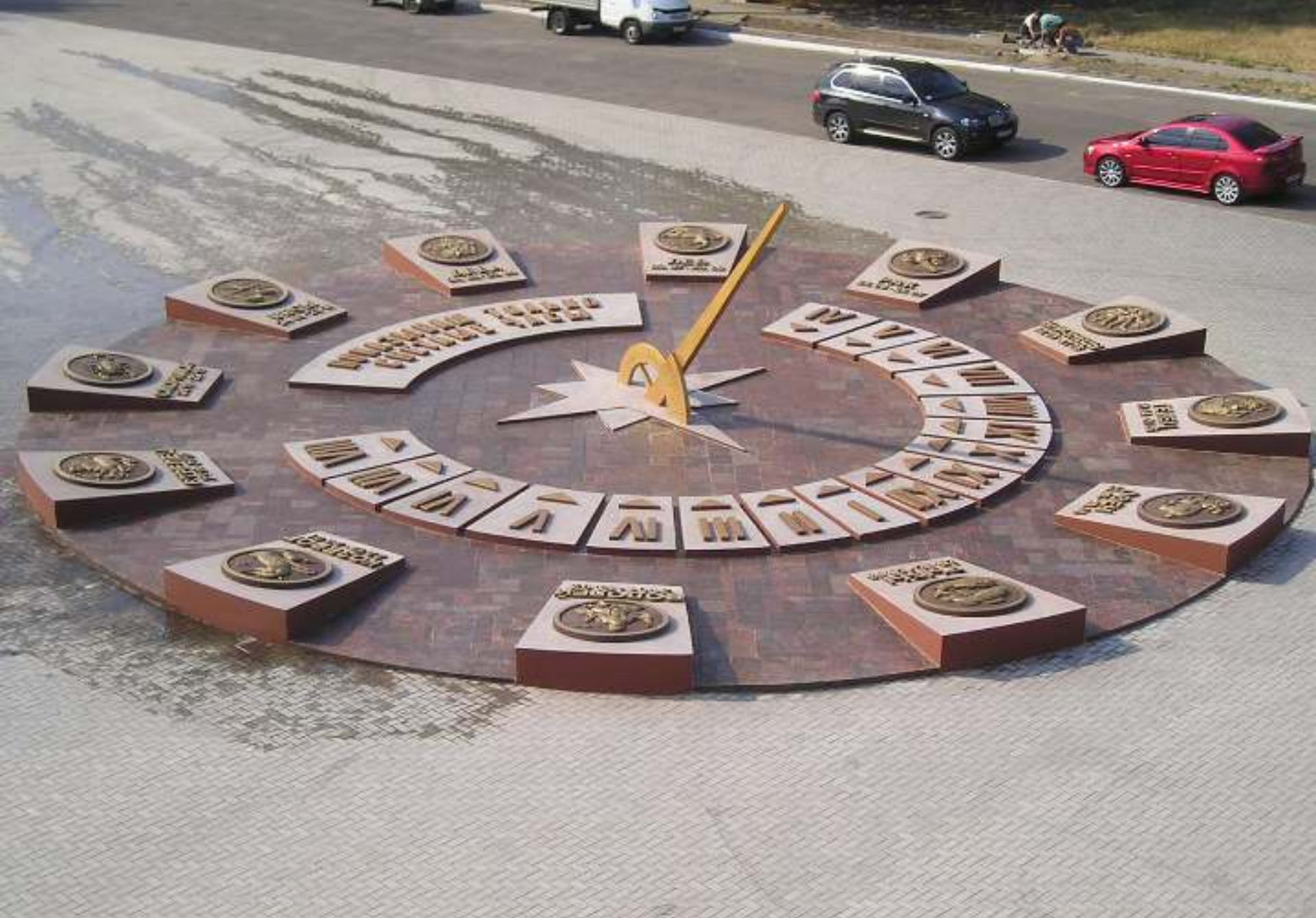
Сонячний годинник. 2010 рік.