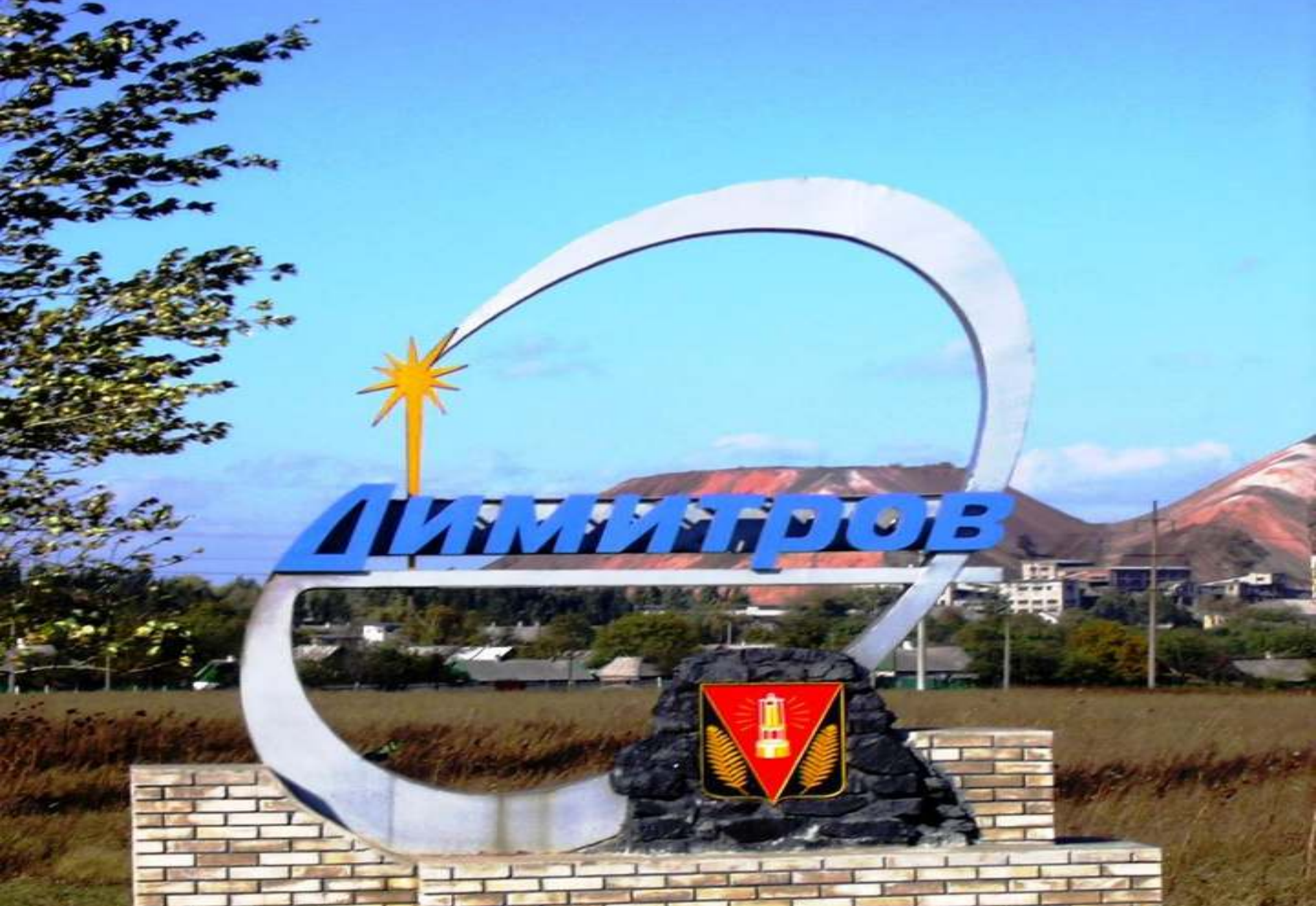
Стела м. Димитров.