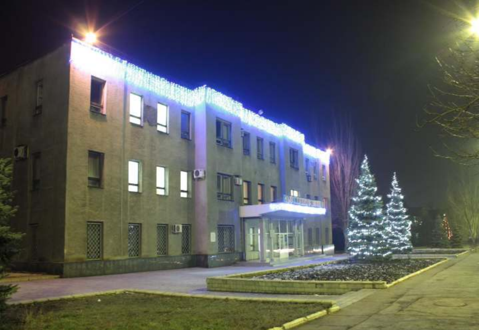
Державне підприємство «Мирноградвугілля». 2015 рік.