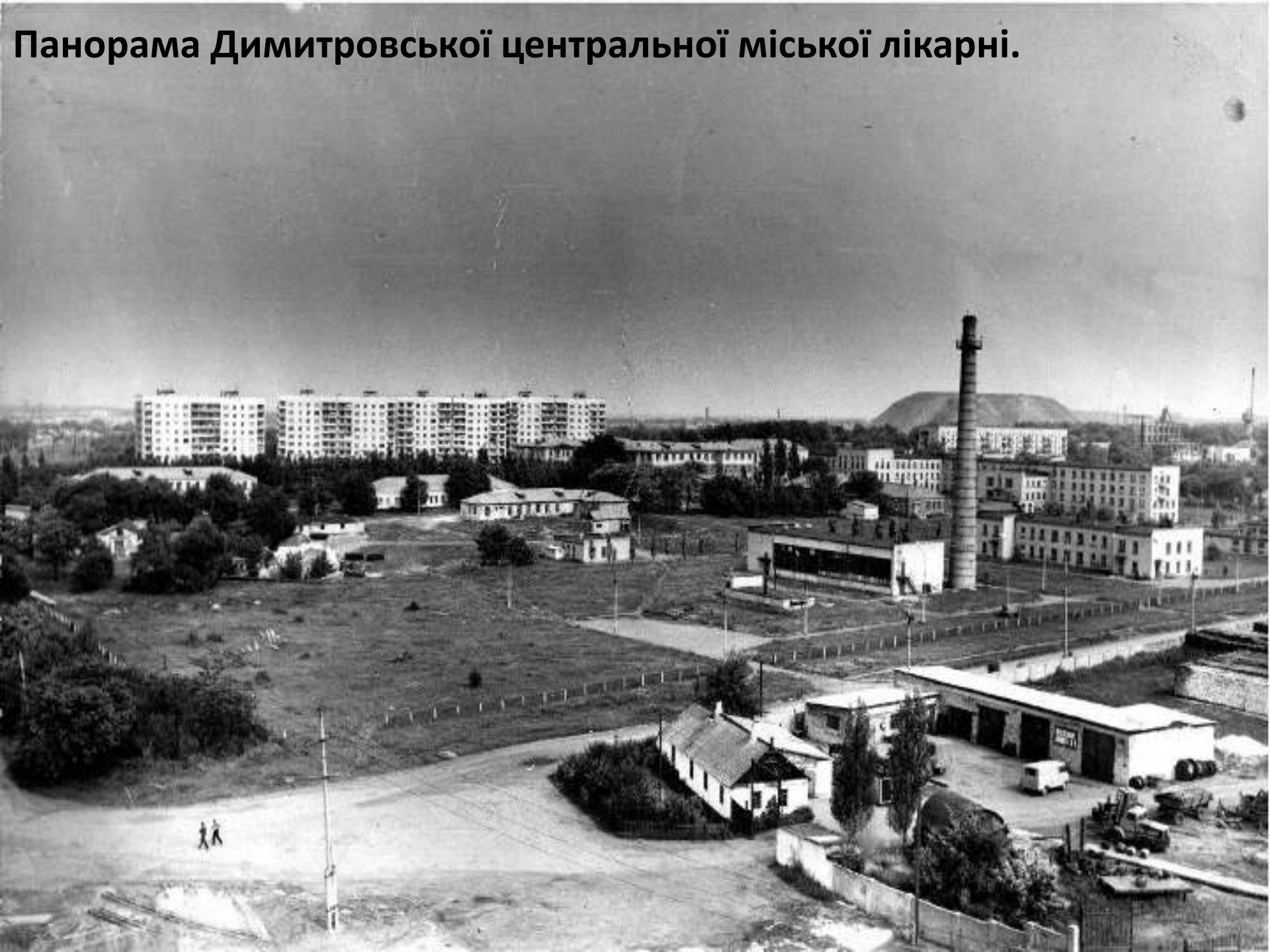
Панорама Димитровської центральної міської лікарні.