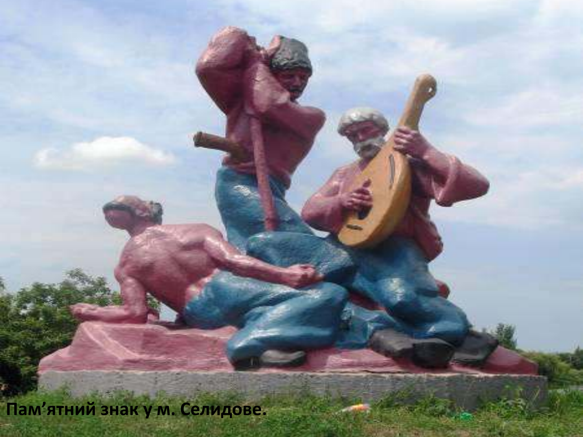
Пам'ятний знак у м. Селидове.