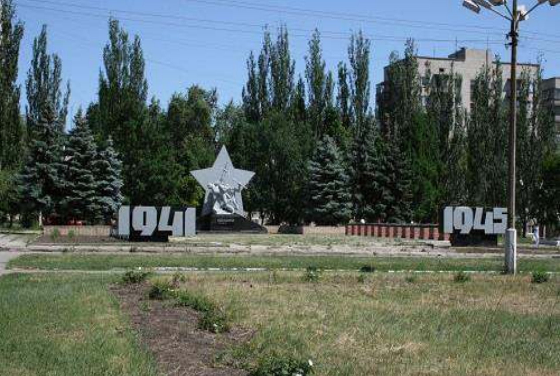
Меморіал Слави загиблим у Другій світовій війні. 2007 рік.