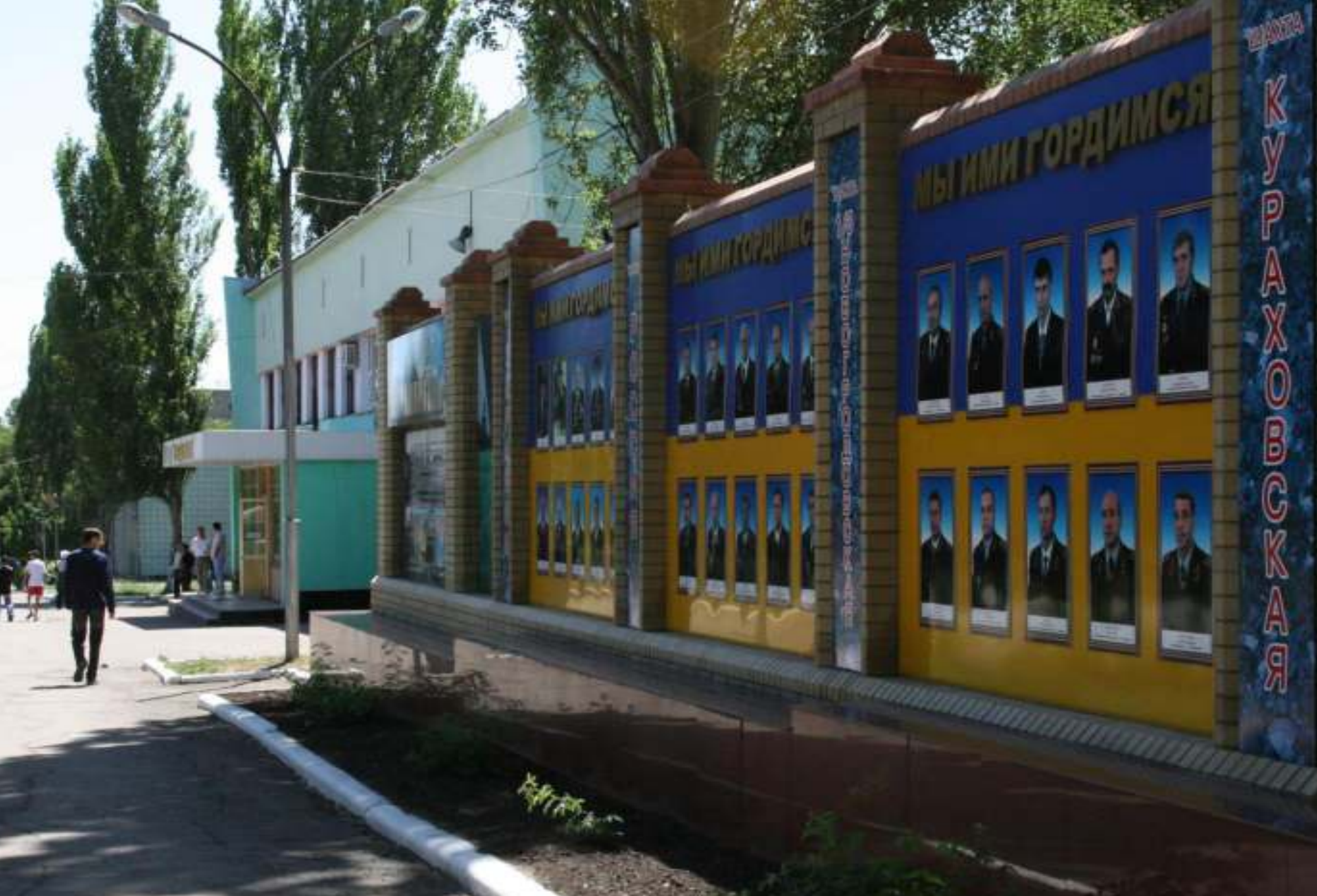
Дошка пошани працівників вугільної промисловості та будівля ДП «Селидоввугілля».