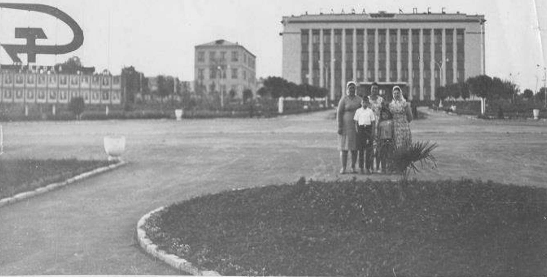
Центральна площа міста Селидове. 1960-ті роки.