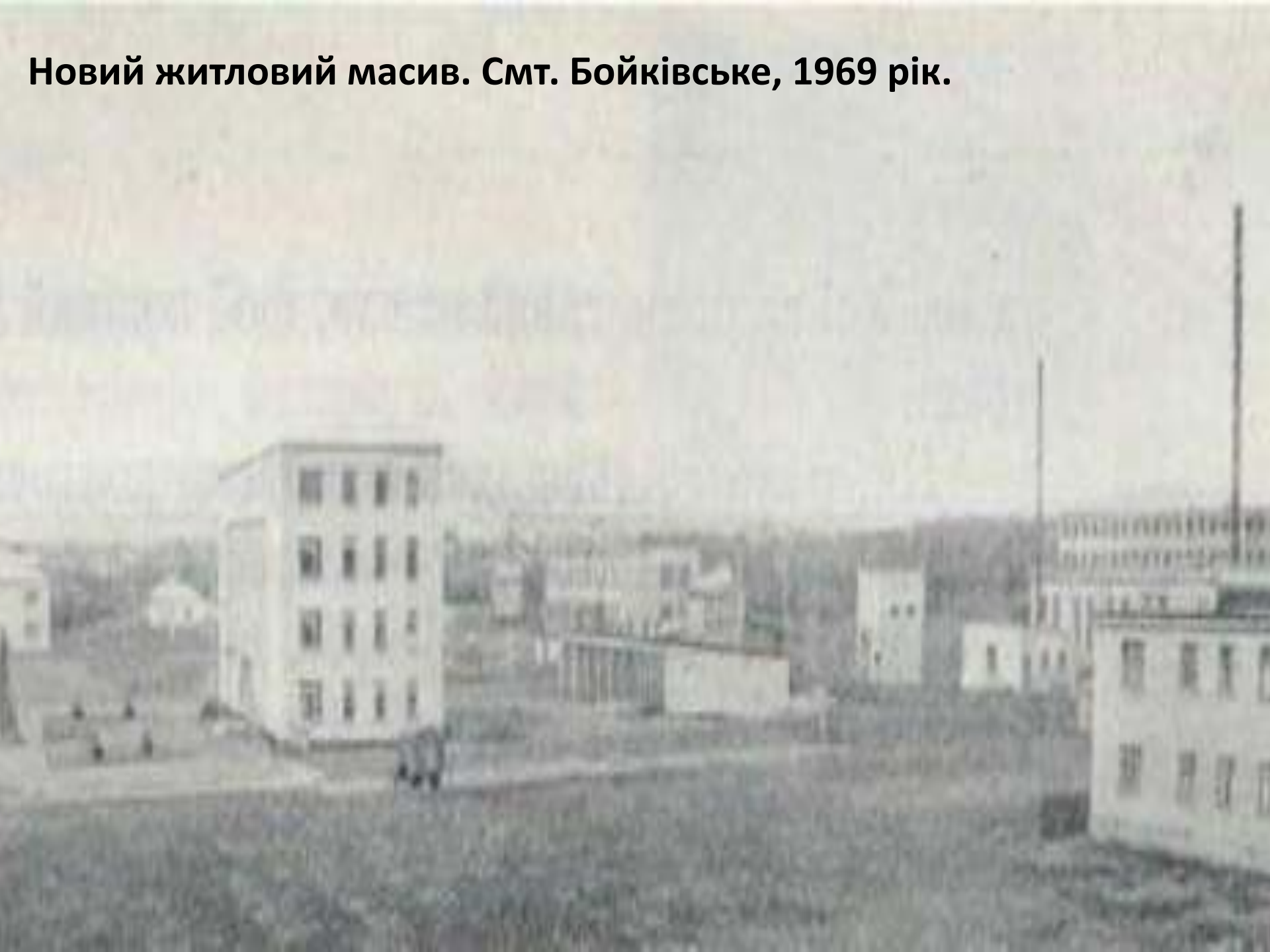
Новий житловий масив. Снт. Бойківське, 1969 рік.