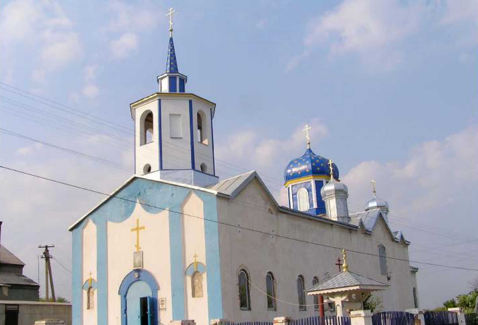
Свято-Преображенський храм. с. Конькове. 2006 рік.