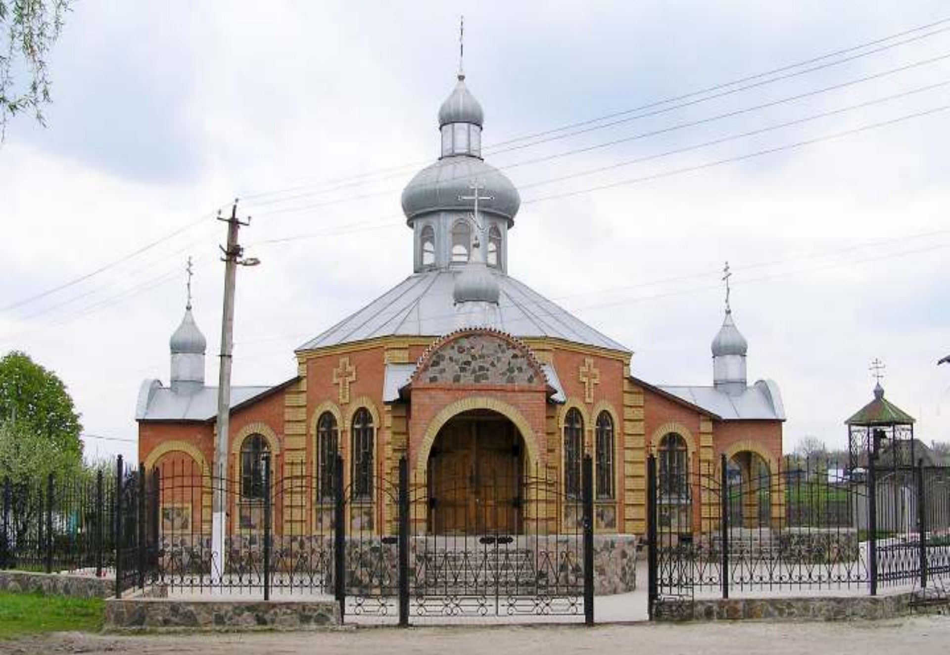
Храм Святих Петра і Павла. с. Свободне. 2008 рік.