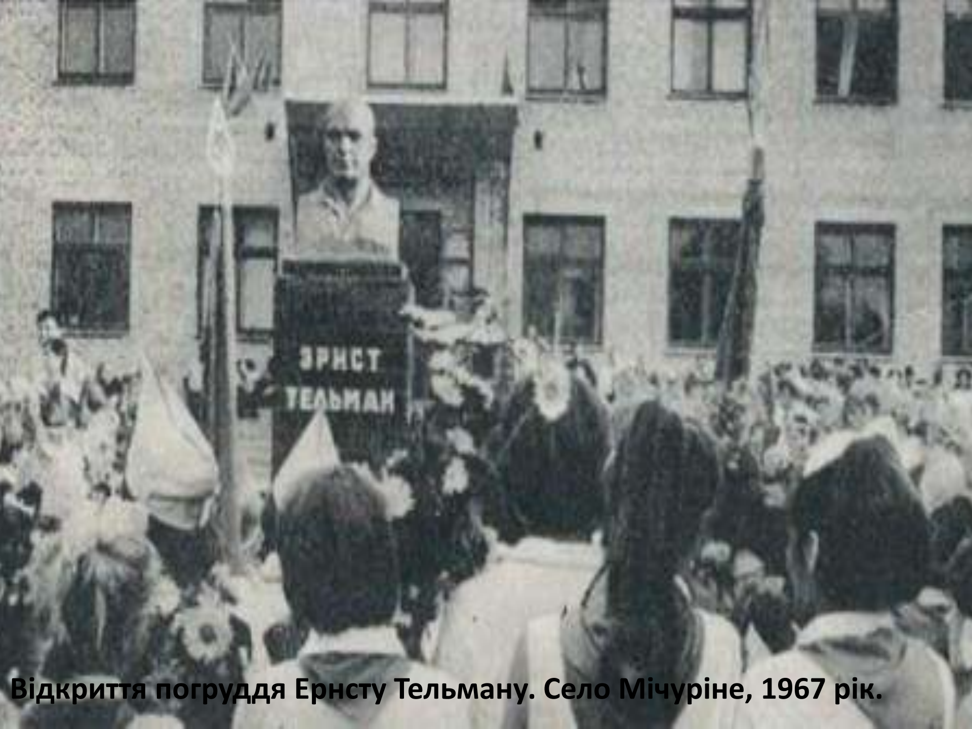
Відкриття погруддя Ернсту Тельману. Село Мічуріне, 1967 рік.