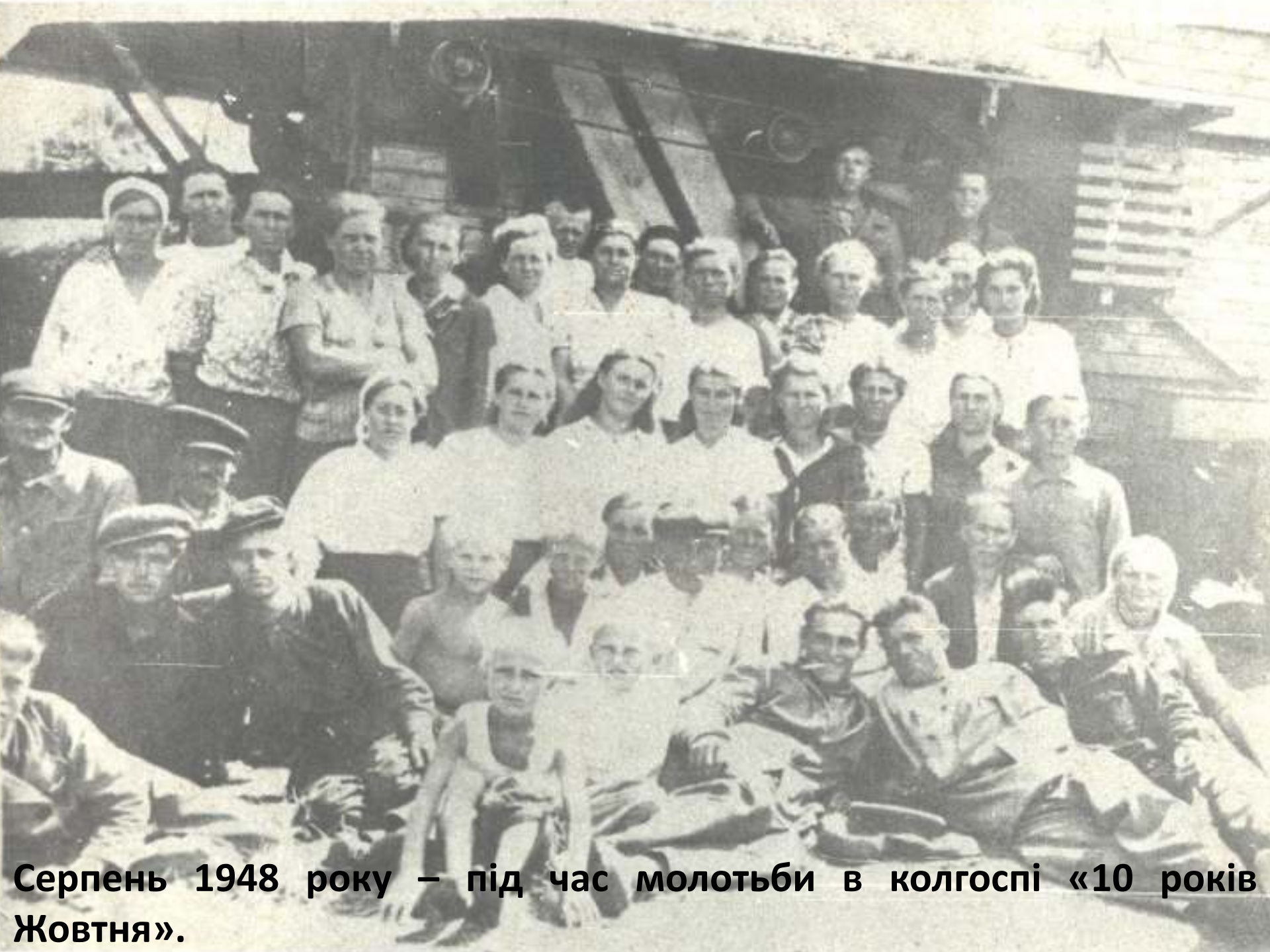
Серпень 1948 року – під час молотьби в колгоспі «10 років Жовтня».