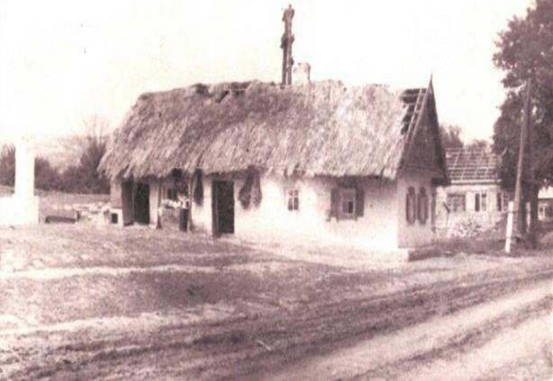
Жовтнева семирічна школа.