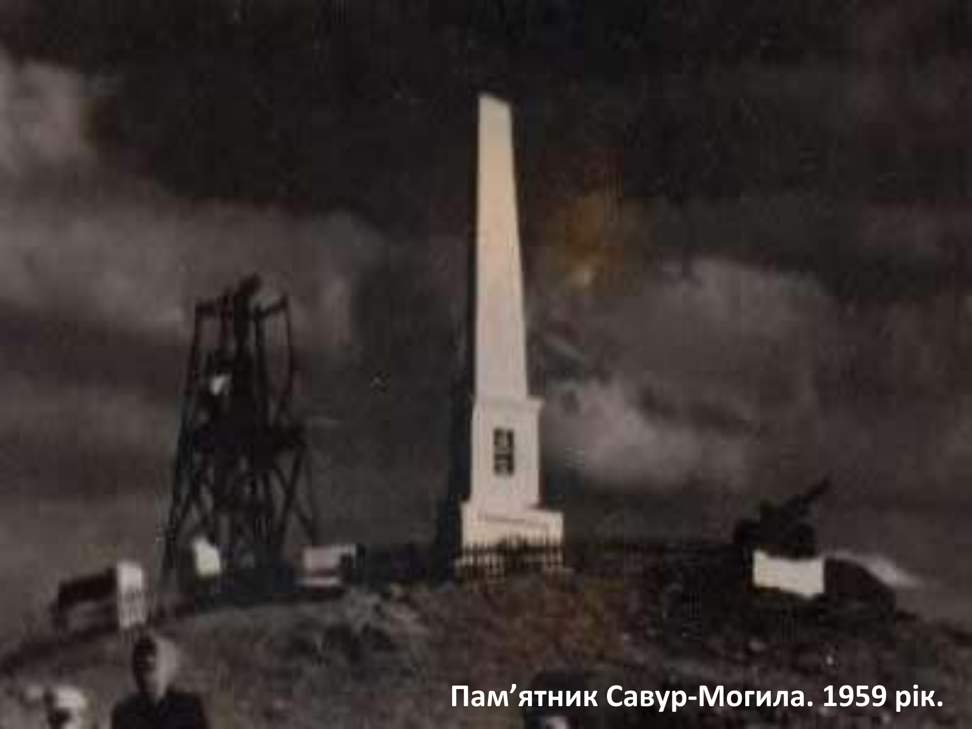
Пам'ятник Савур-Могила. 1959 рік.