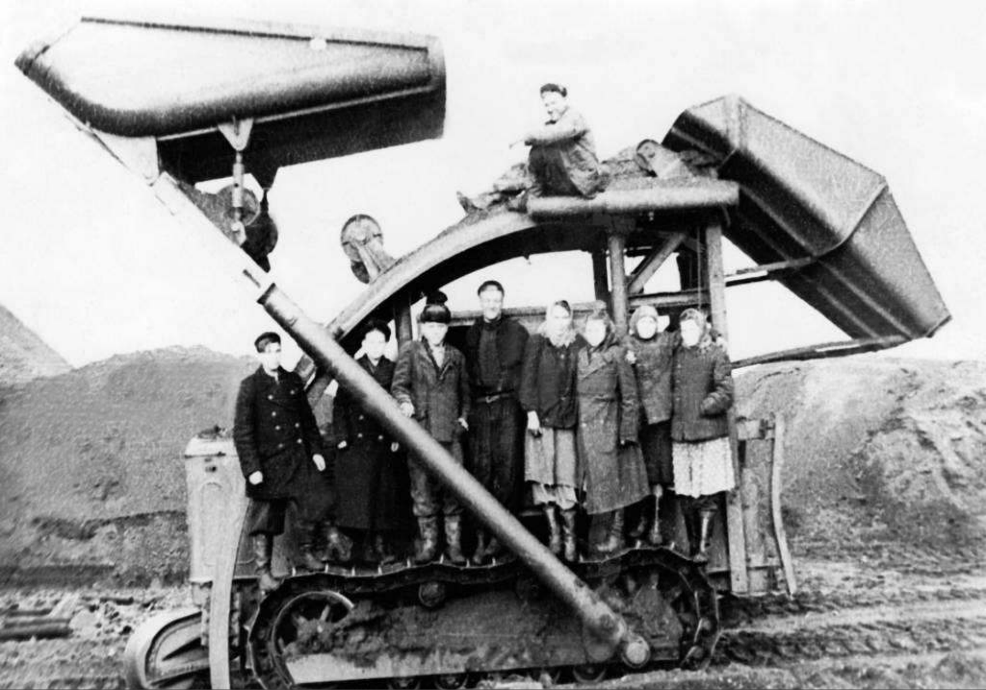
Погрузчик, що використовувався у будівництві. 1950 роки.