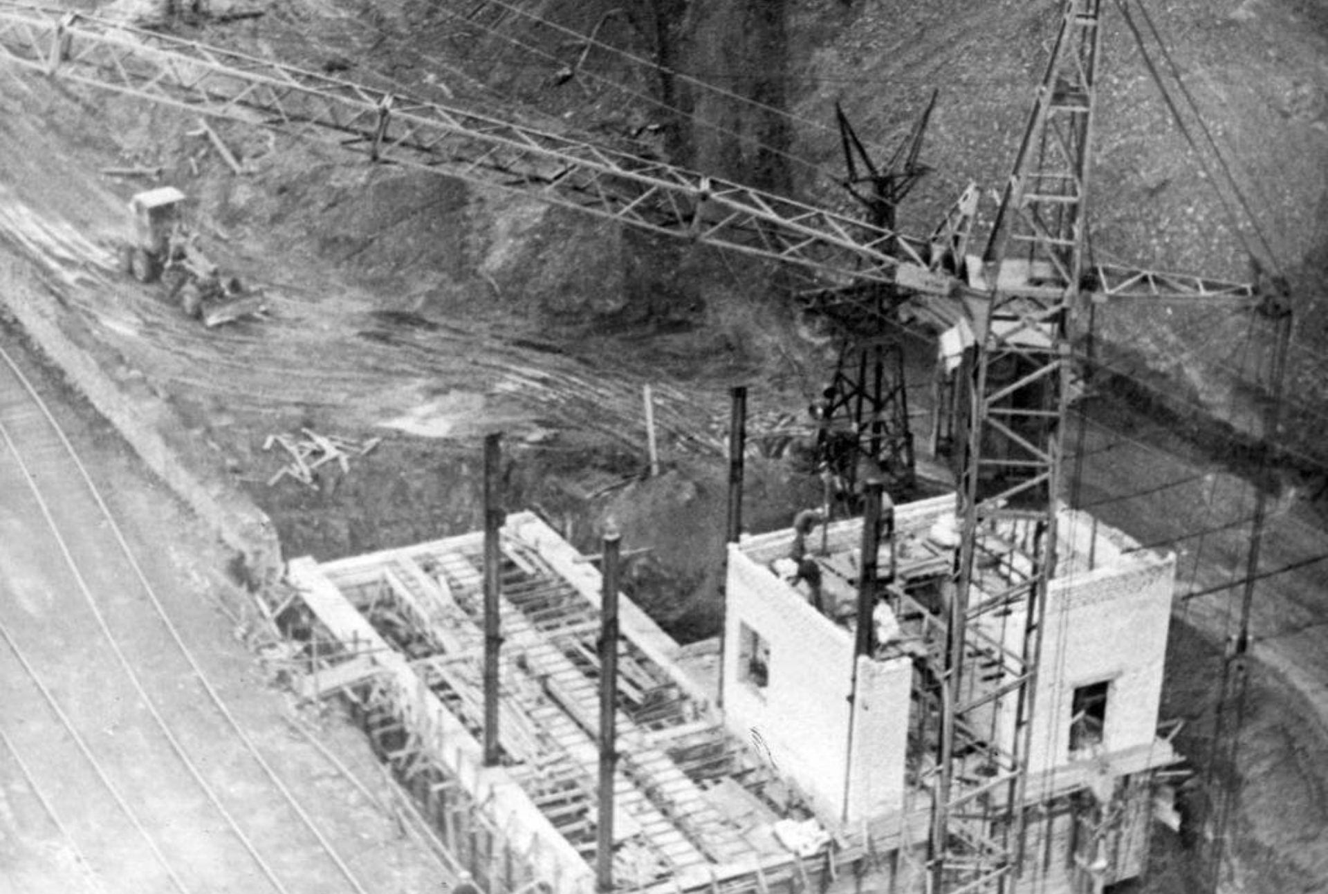
Будівництво цеху збагачувальної фабрики, с. Сердите. 1964 рік.