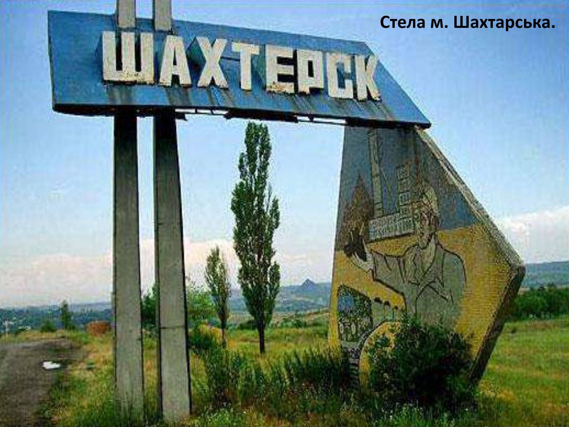
Стела м. Шахтарська.