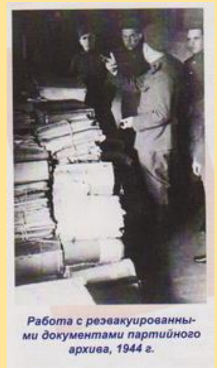
Работа с эвакуированными документами партийного архива, 1944 г.

Після звільнення території області у 1943 році почалося відновлення роботи архівних установ. Початок цьому поклала урядова постанова від 31 серпня 1944 року "Про заходи до створення документальної бази з історії України та історії Вітчизняної війни і впорядкуванню архівного господарства УРСР". Відновлення роботи архівів проводилося в складних умовах, більшість архівних приміщень була зруйнована або пошкоджено. Наказ Народного комісара Внутрішніх справ УРСР від 13 вересня 1944 року № 172 зобов'язав усіх начальників обласних управлінь зайнятися підбором приміщень для обласних, міських та районних архівів, провести ремонт і обладнання приміщень. До 1 листопада 1944 року планувалося завершити концентрацію документів окупаційних установ і повністю укомплектувати штати архівів. У вересні 1943 року Сталінському обласному архіву виділено приміщення у житловому фонді. Але воно не відповідало елементарним архівним вимогам. І вже через місяць за рішенням Сталінського виконкому виділено пристосоване приміщення, придатне для зберігання документів. Поступово міські та районні архіви теж відновлювати свою роботу. На початок 1945 року в області вже діяв 31 міські та районні архіви. Але приміщення мали тільки 17 архівів.