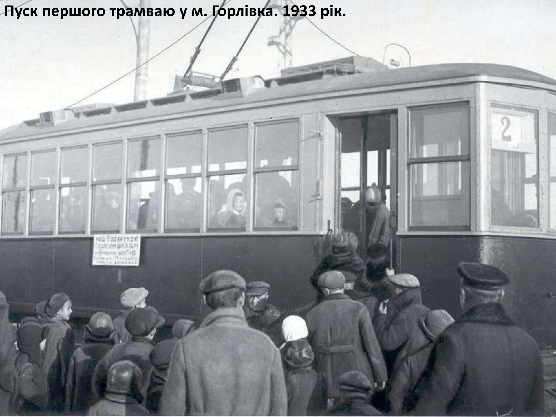
Пуск першого трамваю у м. Горлівка. 1933 рік.