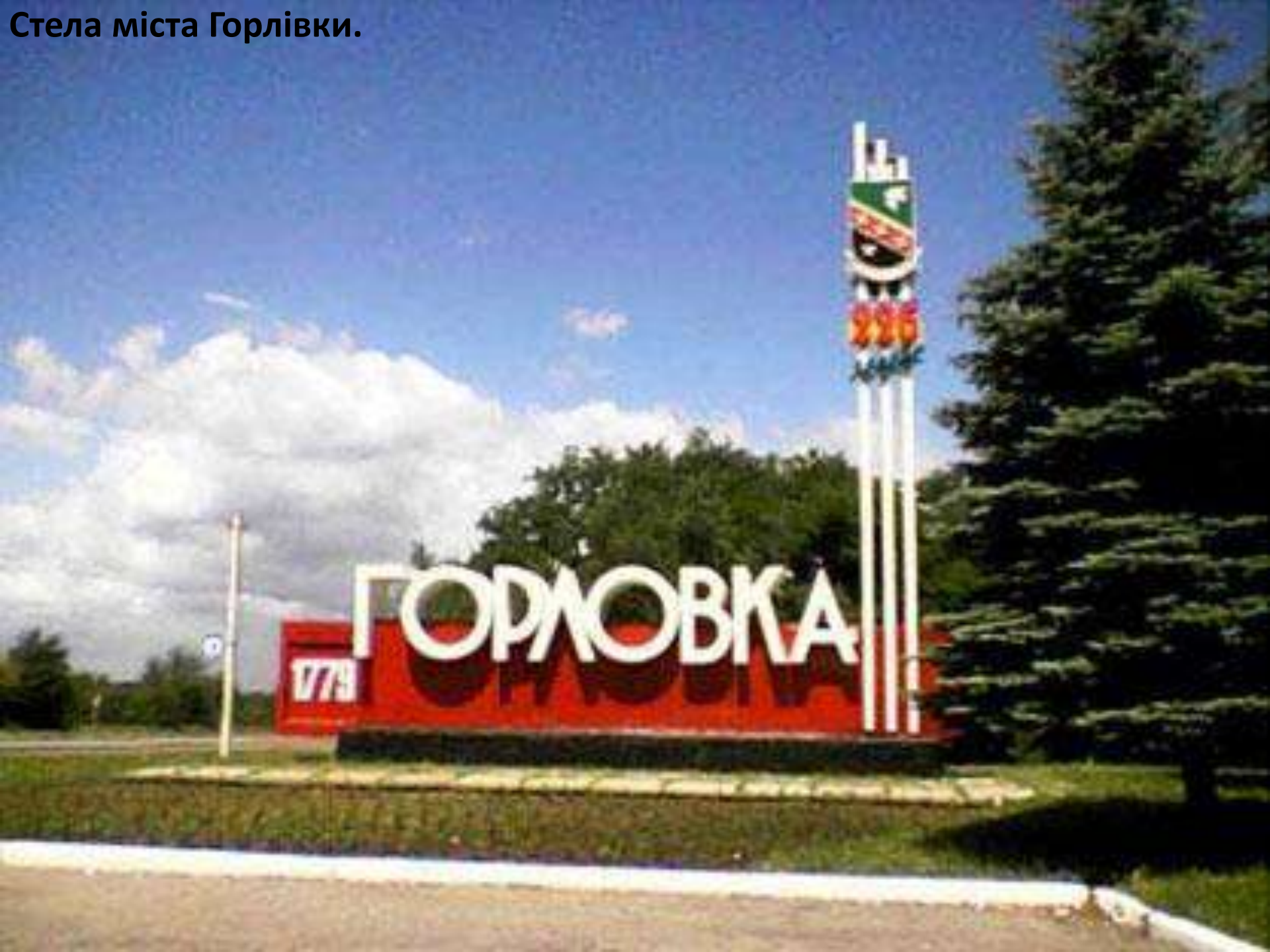
Стела міста Горлівки.