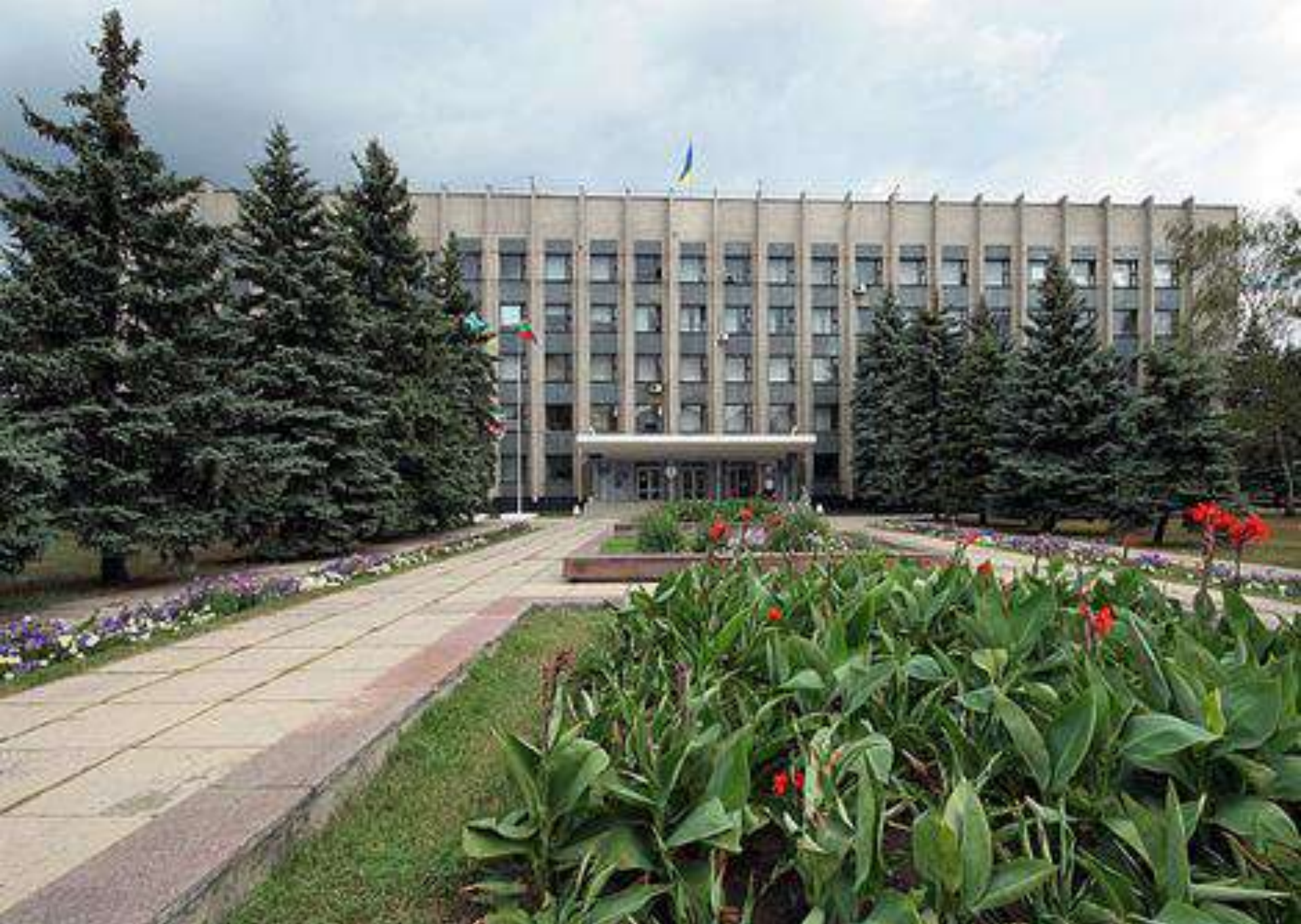
Адміністративна будівля Горлівської міської ради. 2010 рік.