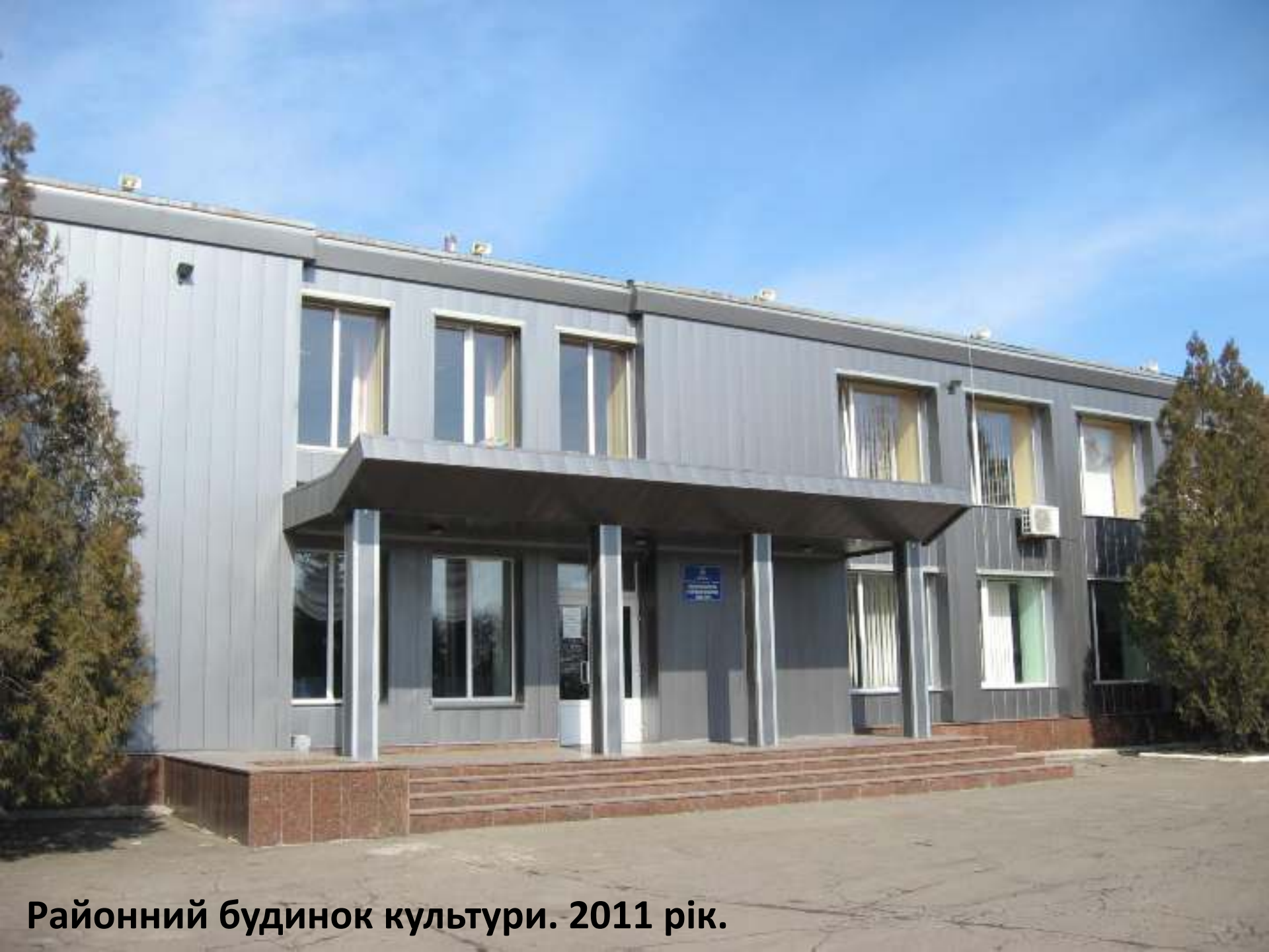
Районний будинок культури. 2011 рік.