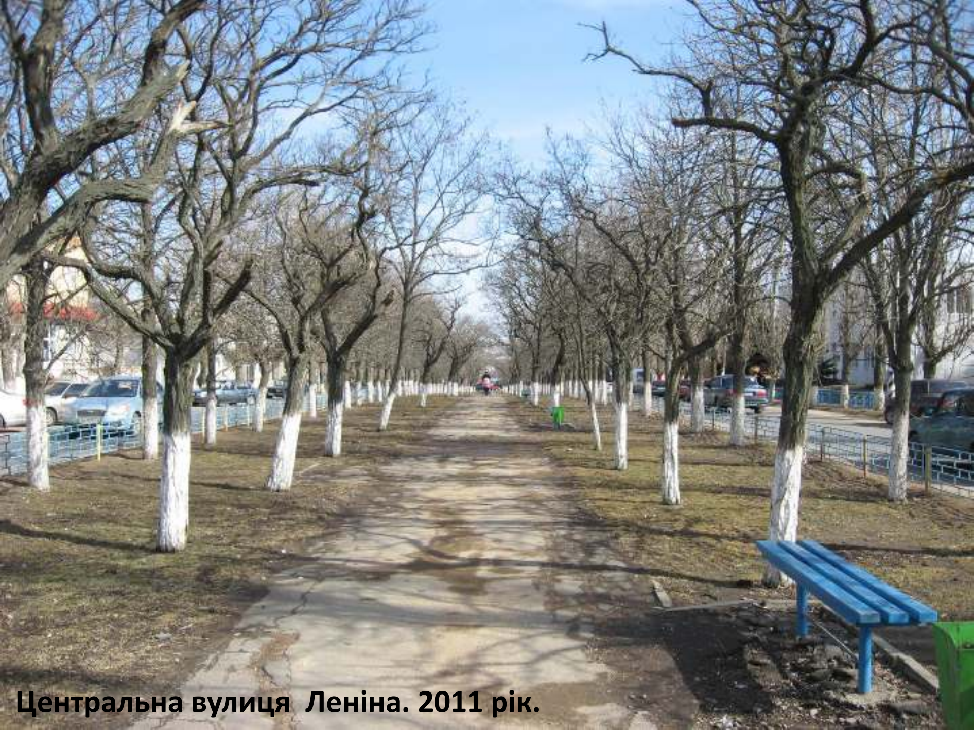
Центральна вулиця Леніна. 2011 рік.