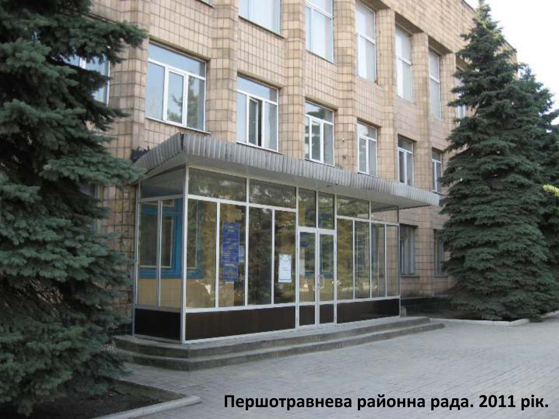
Першотравнева районна рада. 2011 рік.