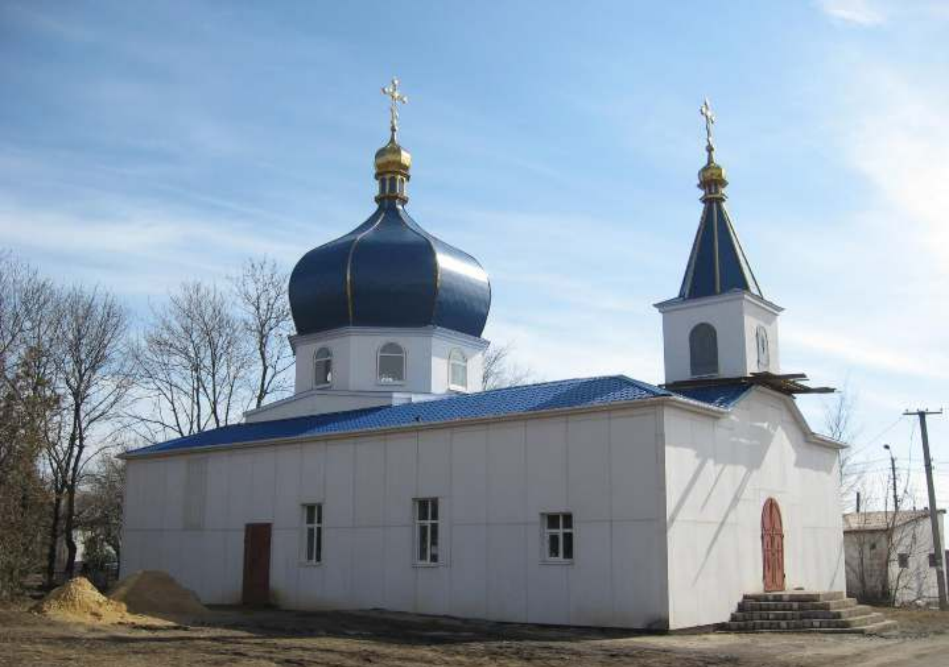
Будівництво церкви святого великомученика Федора Стратилата. 2011 рік.