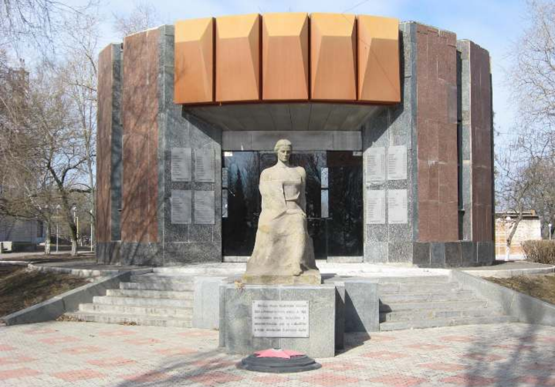
Пам'ятник Пантеон Слави. 2011рік.