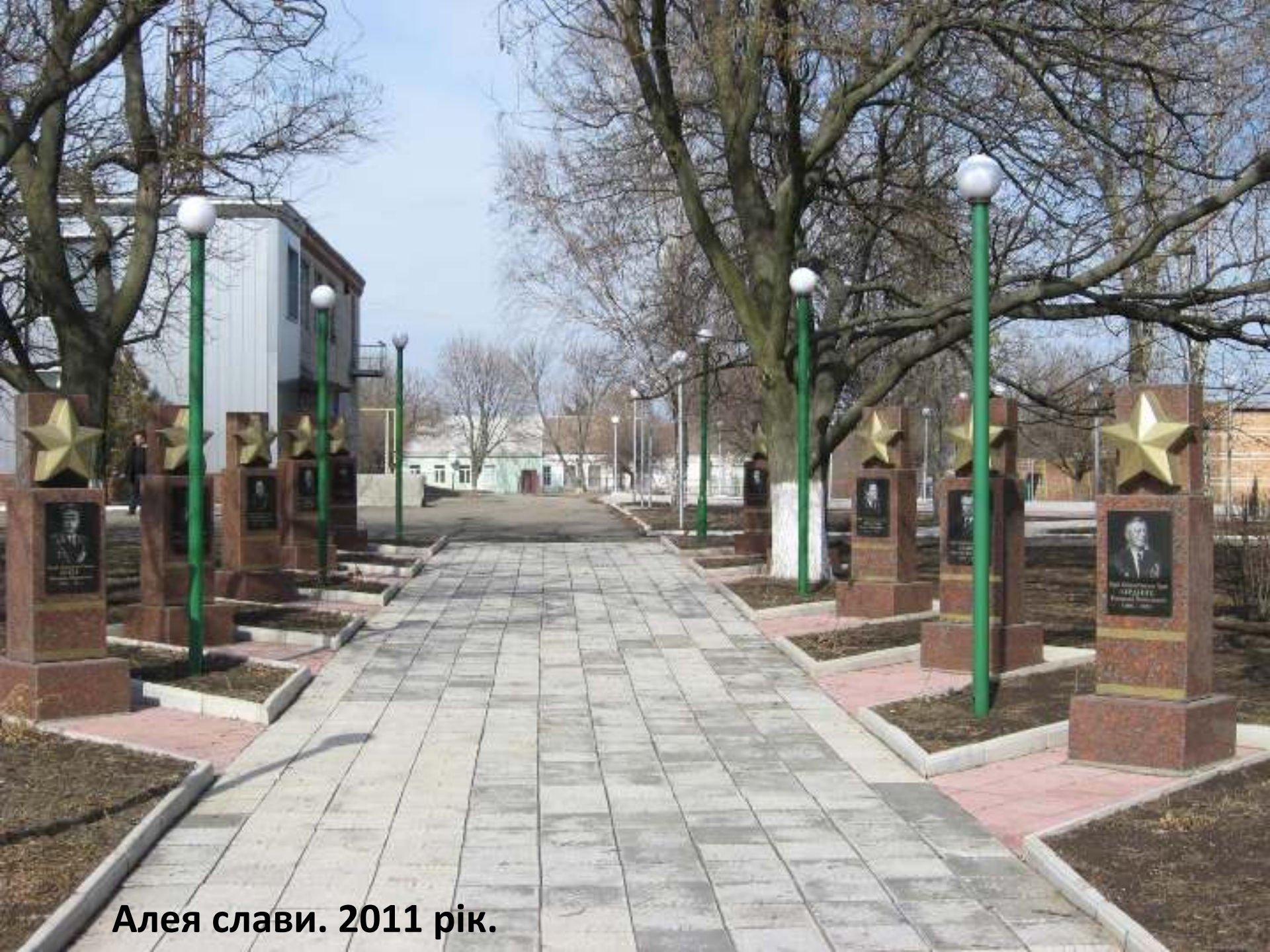
Алея слави. 2011 рік.