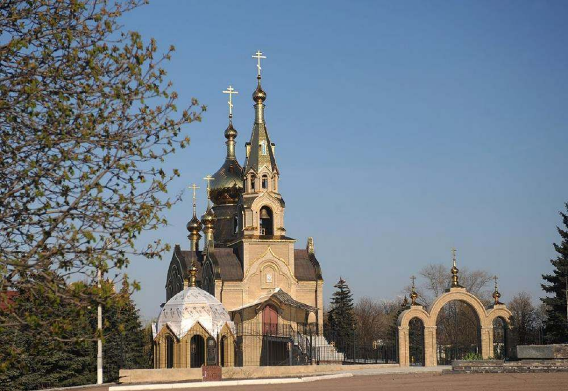
Церква Казанської Божої Матері в м. Мар'їнка.