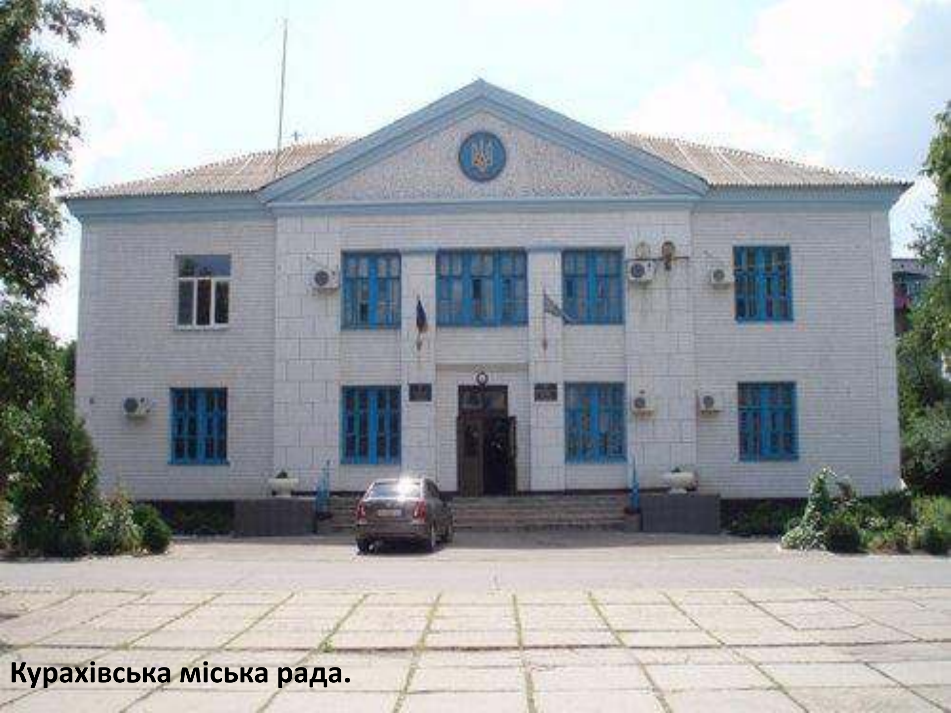
Курахівська міська рада.