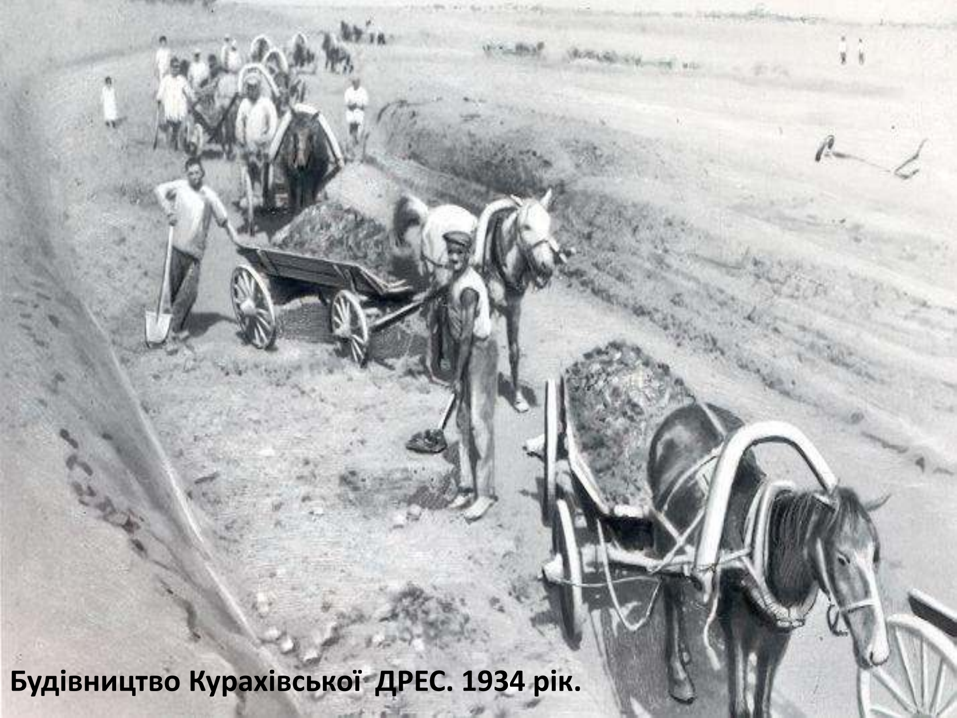
Будівництво Курахівської ДРЕС. 1934 рік.