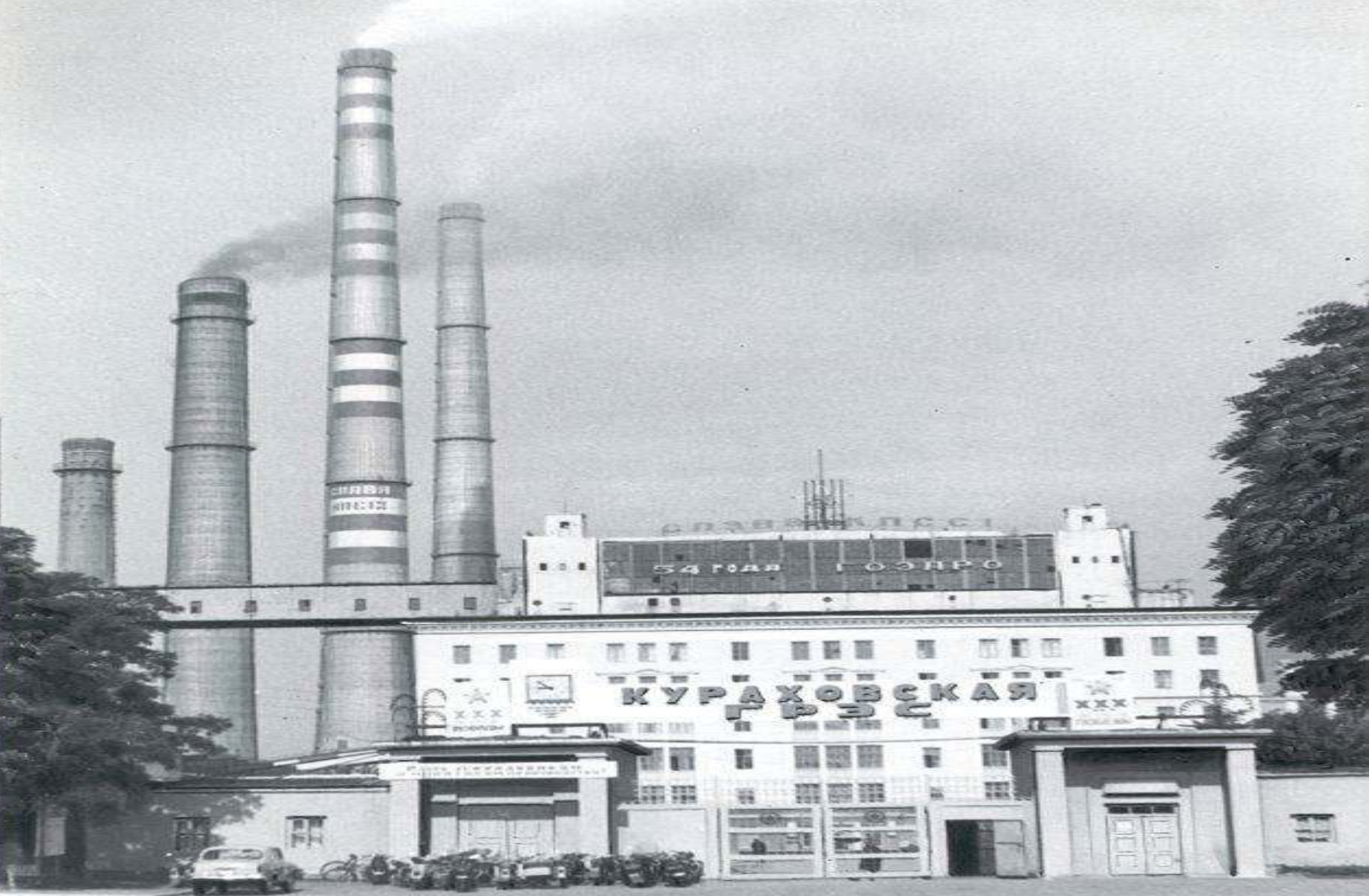
Курахівська ДРЕС. 1975 рік.